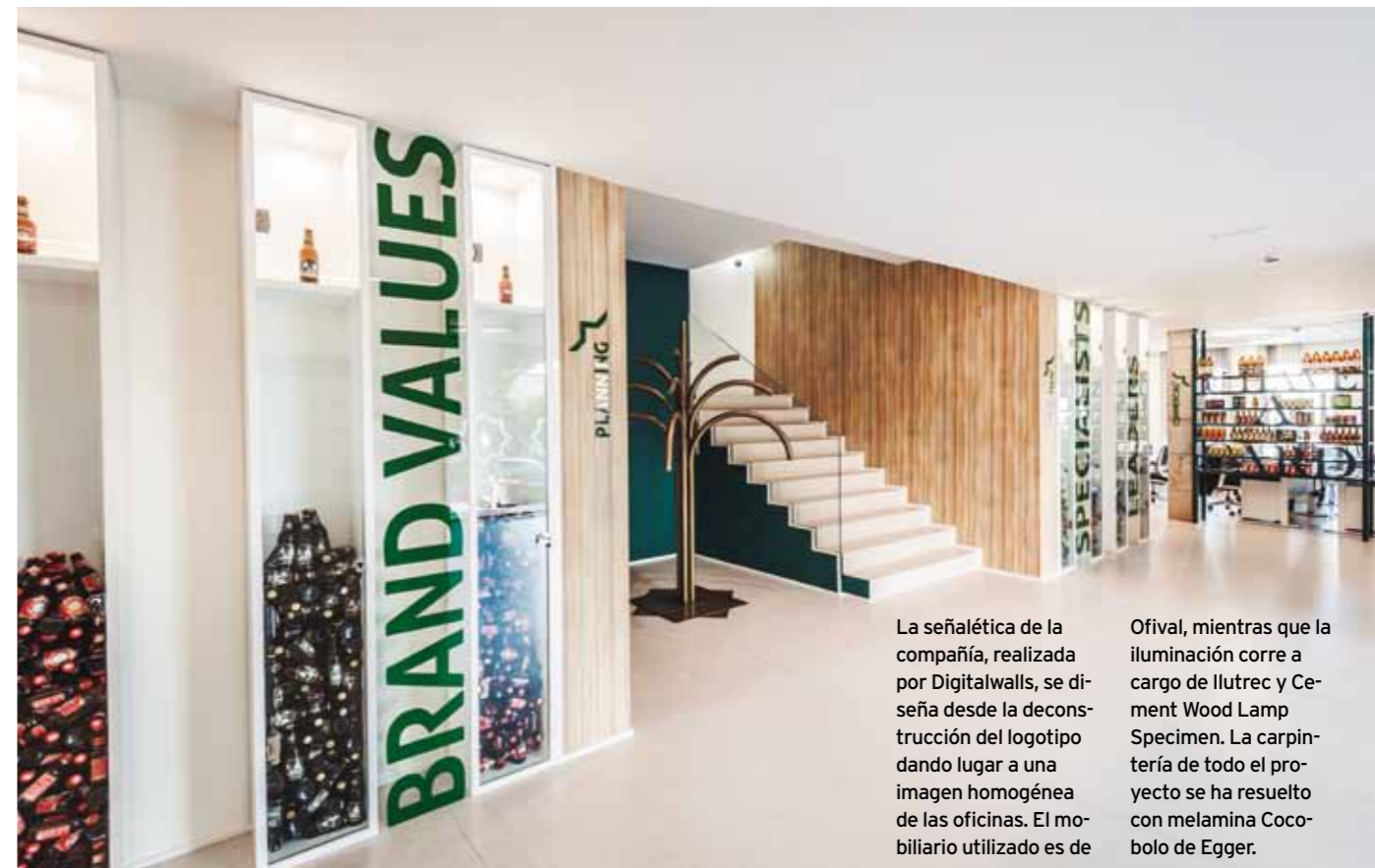
La señalética de la compañía, realizada por Digitalwalls, se diseña desde la deconstrucción del logotipo dando lugar a una imagen homogénea de las oficinas. El mobiliario utilizado es de Ofival, mientras que la iluminación corre a cargo de Ilutrec y Cement Wood Lamp Specimen. La carpintería de todo el proyecto se ha resuelto con melamina Cocobolo de Egger.